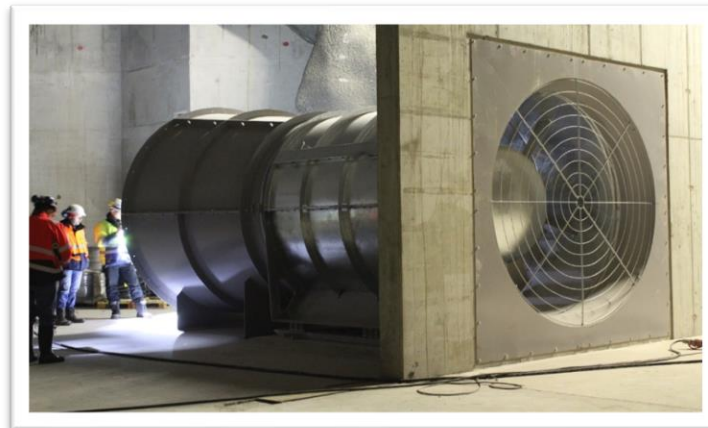
Figura 2 Ventilatore assiale tipo in centrale di ventilazione per sistemi trasversali

Ventilatori centrifughi per estrazione massiva dei fumi certificati secondo la EN12101-3:2015, classe F400 (400°C – 2h) ma con resistenze meccaniche a temperature ben più alte ed in continuo (fino a 900°C), con diametri delle giranti fino a 4000 mm, portate elaborate fino a 4 milioni di m 3 /h con pressione fino a 30000 Pa, potenze installate fino a 5 MW.